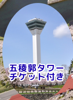
五稜郭タワー チケット付き