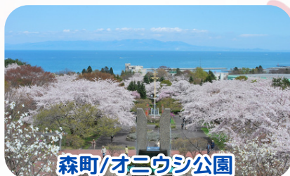
森町/オニウシ公園