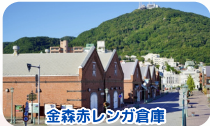
金森赤レンガ倉庫