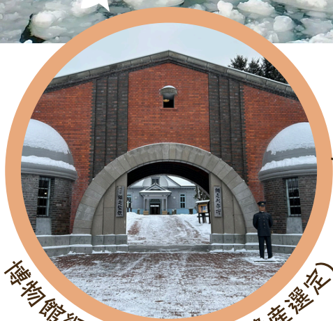
博物館網走監獄(北海道遺産選定)