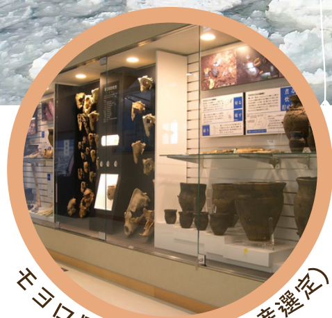
千石口貝塚館(北海道遺産選定)