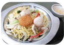
【2日目昼食】 オホーツク塩焼きそば