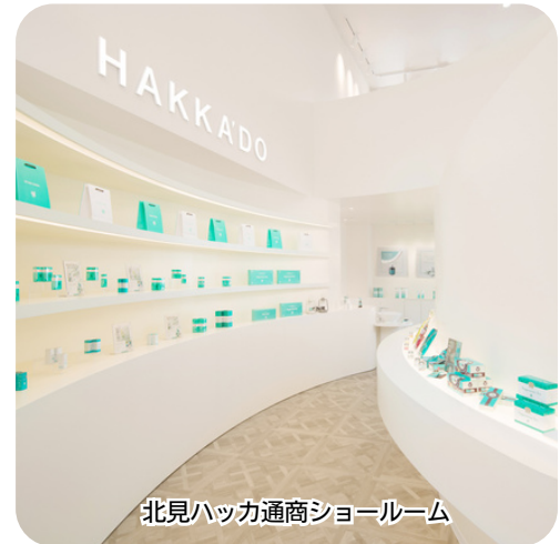
北見ハッカ通商ショールーム