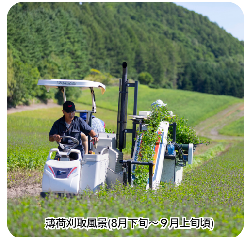
薄荷刈取風景(8月下旬~9月上旬頃)