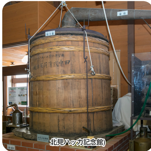
北見ハッカ記念館