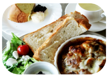
【1日目昼食】 ハーブランチセット