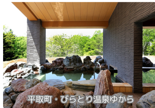
平取町・びらとり温泉ゆから

集合 / 中央バス札幌ターミナル1階待合室・地下鉄大谷地駅②出口(出発の15分前集合)