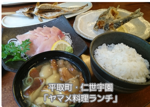
平取町・仁世宇園 「ヤマメ料理ランチ」