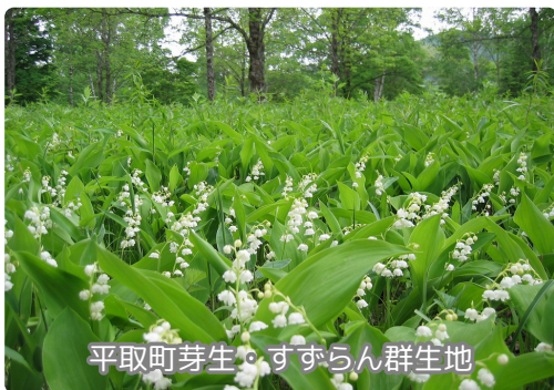
平取町芽生・すずらん群生地