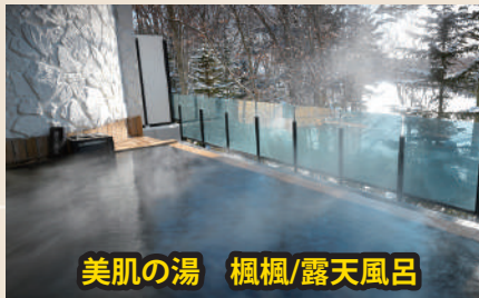
美肌の湯 楓楓/露天風呂