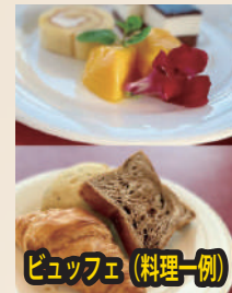
ビュッフェ(料理一例)