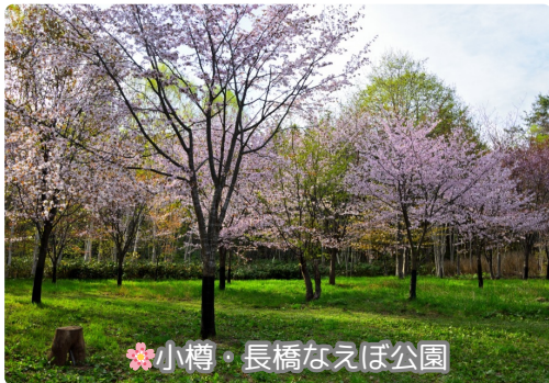
小樽・長橋なえぼ公園