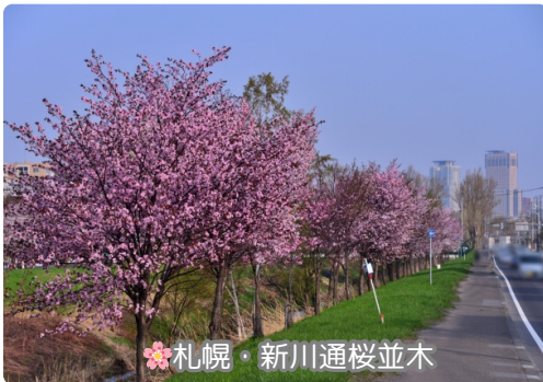
札幌・新川通桜並木