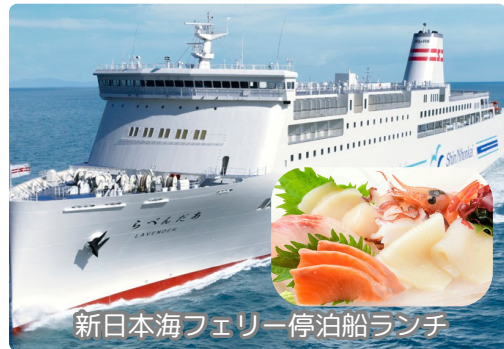
新日本海フェリー停泊船ランチ