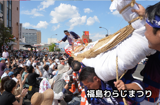
福島わらじまつり