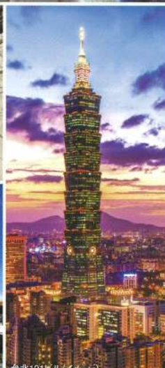
台北101ビル(イメージ)