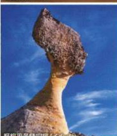
野柳風景特定区(イメージ)