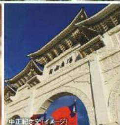
中正紀念堂(イメージ)