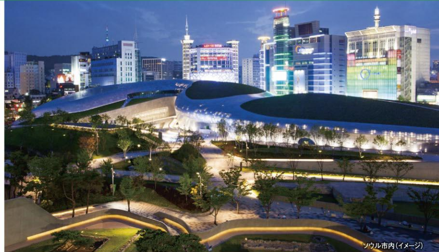
ソウル市内(イメージ)