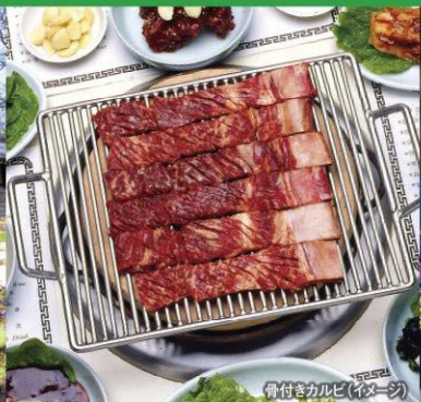
骨付きカルビ(イメージ)