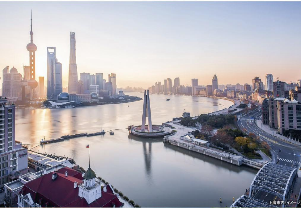
上海市内(イメージ)