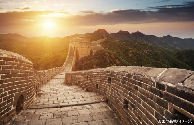
万里の長城(イメージ)