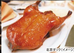
北京ダック(イメージ)